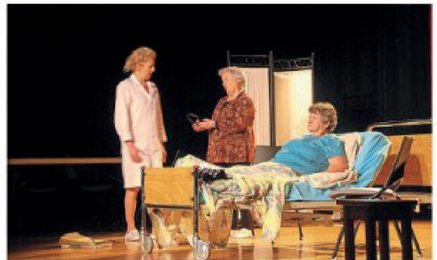
Comme une ritournelle, une pièce de théâtre sur le thème de la maladie d'Alzheimer jouée avec humour par la troupe En mémoire d'Eux

Comme une ritournelle dimanche au Gentieg