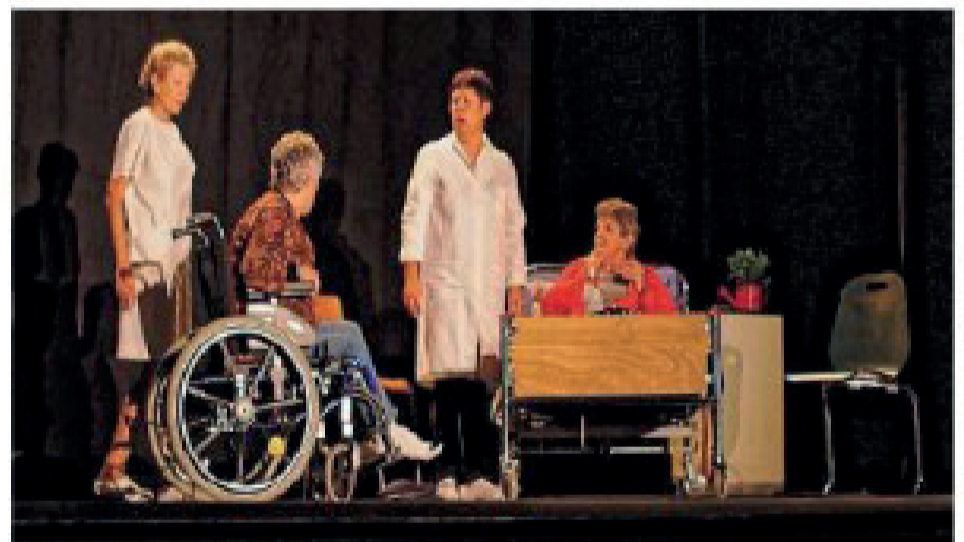
Une scène de la pièce « Comme une ritournelle ».

Le théâtre pour aborder la maladie d'Alzheimer