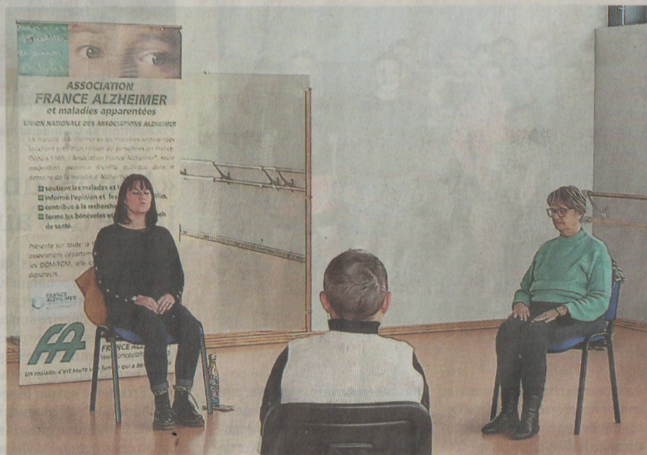
Cours de sophrologie pour les aidants.

Troubles de la mémoire retentissant sur la vie de la personne malade, oubli d'événements récents, d'informations nouvelles, troubles du langage, du raisonnement, de l'humeur, autant de signes qui peuvent alerter. Oser en parler ! Ne pas rester dans le doute... surtout ne pas s'isoler... en parler avec son médecin... et il existe des consultations mémoire spécia-