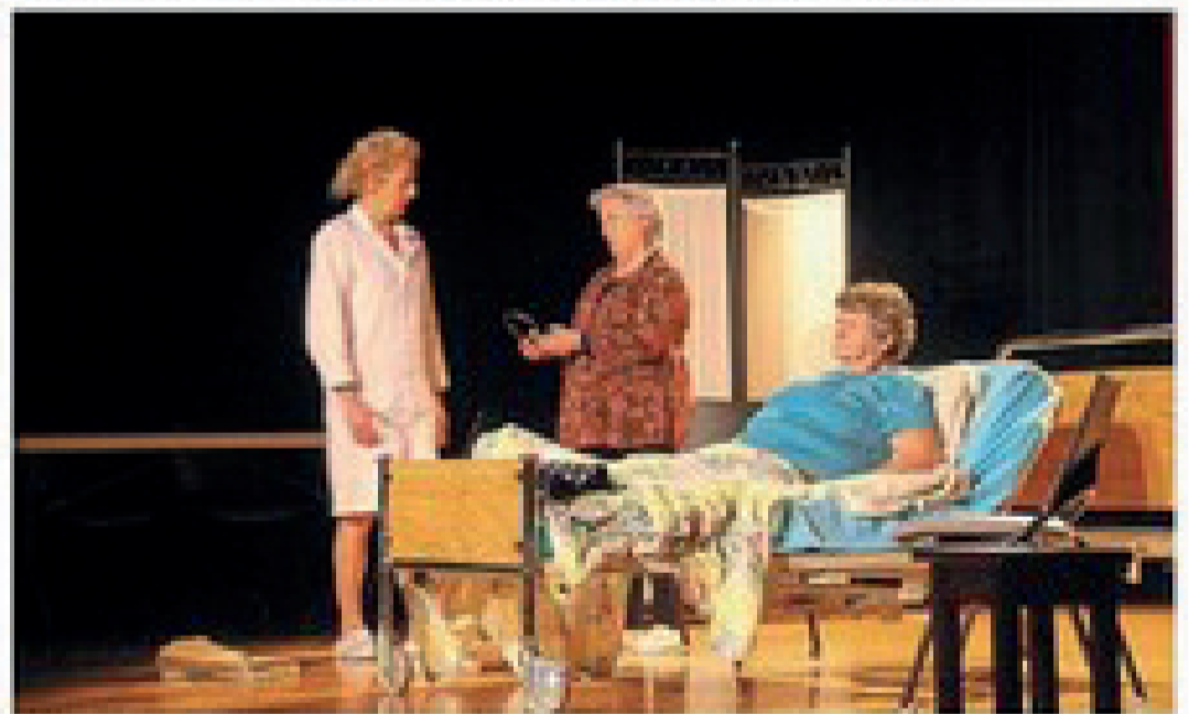
Comme une ritournelle, une pièce de théâtre sur le thème de la maladie d'Alzheimer jouée avec humour par la troupe En mémoire d'eux.