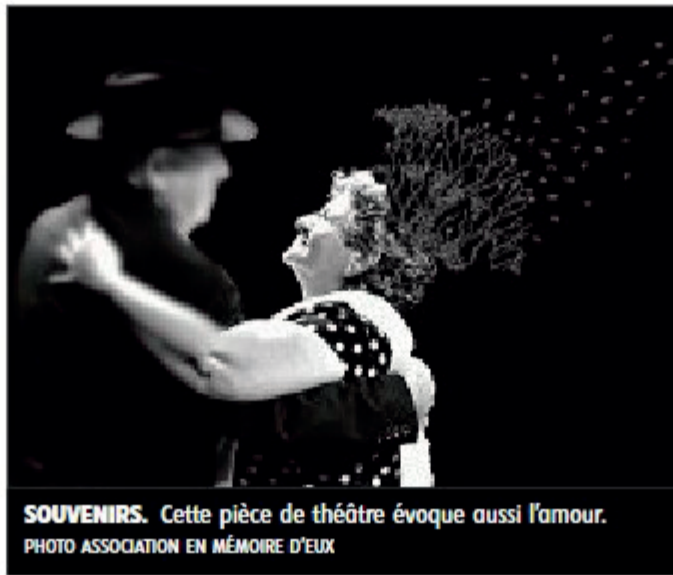
SOUVENIRS. Cette pièce de théâtre évoque aussi l'amour.

■ Comment avez-vous réussi pour l'écriture de cette pièce ? Finalement, cela s'est fait simplement. Au départ, ce sont les élèves de ma classe de théâtre qui ont souhaité aborder un thème plus profond. Rapidement, la maladie d'Alzheimer s'est imposée. En fait, tout le monde connaît quelqu'un qui est tou-