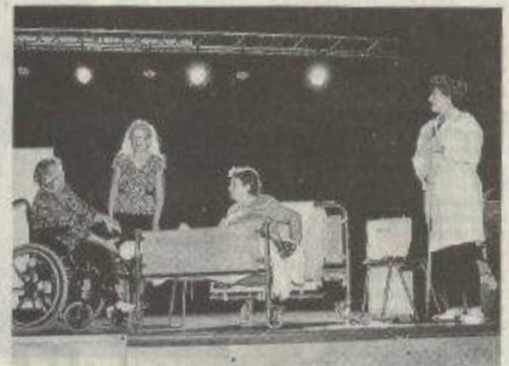
Vue de la scène.

L'association En mémoire d'eux a présenté au public de Lannemezan une approche drôle et émouvante pour aborder les troubles causés par la maladie d'Alzheimer.