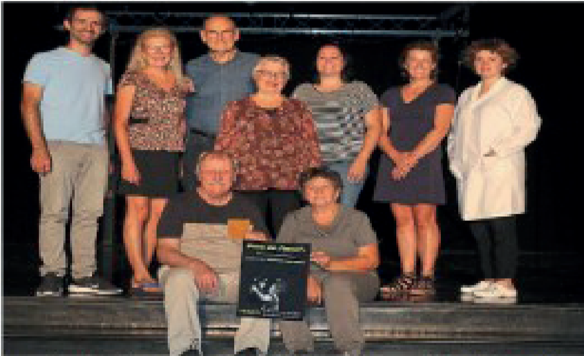
Les acteurs de l'association culturelle de Cordemais seront à Comé, dimanche 5 février, pour jouer « Comme une ritournelle ».

Théâtre : immersion dans la maladie d'Alzheimer