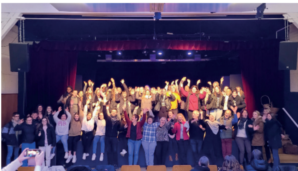
Représentation lycée Daunot (aide à la personne) - Nancy - Février 2023